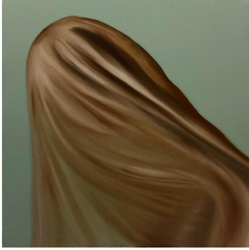
Mutsuzluğun Tuhaf Tesellisi 2020

Tuval üzerine yađlı ve akrilik boya, 60 x 60 cm