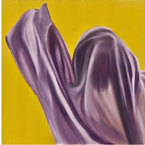
Tereddütün Kokusu 2020

Tuval üzerine yađlı ve akrilik boya, 50 x 50 cm