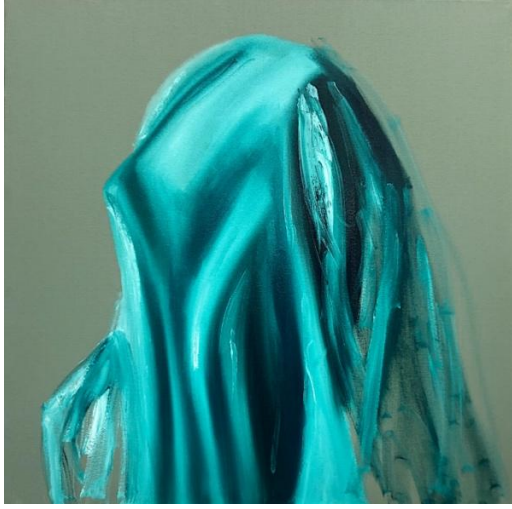
Kadın Olduđuna Emin Misin? 2020

Tuval üzerine yađlı ve akrilik boya, 50 x 50 cm