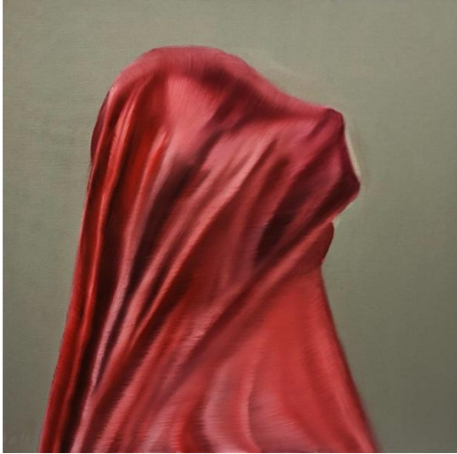
Hatıрата Dalıř 2020

Tuval üzerine yađlı ve akrilik boya, 60 x 60 cm